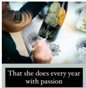
That she does every year with passion

毎年ソフィー女史はキュベ・プレスティージュ・ワインの内、数ケースに手描きで絵を描きます。繊細な作業なので丁寧に時間を掛けて1本、1本絵付けします。