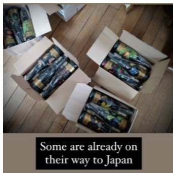
Some are already on their way to Japan

ソフィー女史はいつも並々ならぬ情熱を傾けて絵を描いていきます。彼女のインスピレーションを表現した唯一無二のペインティングボトルが出来上がります。