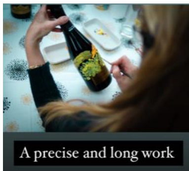
A precise and long work

毎年ソフィー女史はキュベ・プレスティージュ・ワインの内、数ケースに手描きで絵を描きます。繊細な作業なので丁寧に時間を掛けて1本、1本絵付けします。