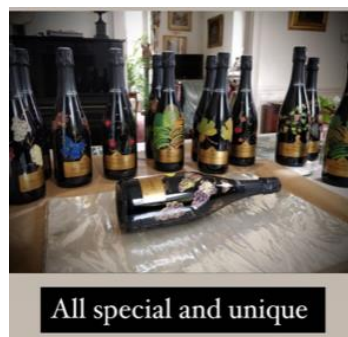
All special and unique

ソフィー女史はいつも並々ならぬ情熱を傾けて絵を描いていきます。彼女のインスピレーションを表現した唯一無二のペインティングボトルが出来上がります。