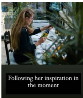
Following her inspiration in the moment