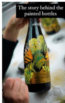
The story behind the painted bottles